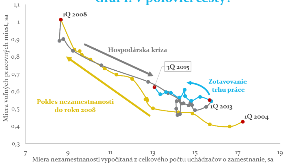
Graf 1: V polovici cesty?

* Krivka bola zostavená z údajov o voľných pracovných miestach podľa ŠÚ SR. Voľné pracovné miesta podľa ÚPSVaR sú od roku 2014 ovplyvnené nahlasovaním cez verejný pracovný portál (ISTP).